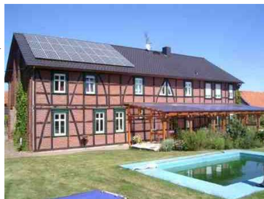
Plan du champs modules

Distance champs modules – onduleurs : max. 40 m